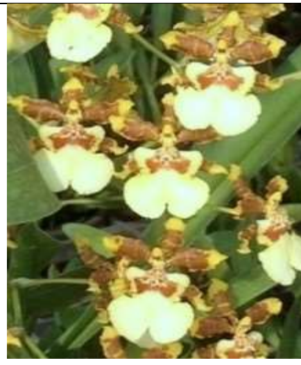
Yuan Nan Gold Code:8004