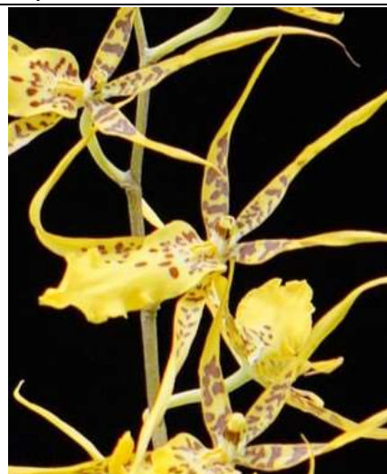
Brassia "Yellow" Code:8005

http://antilles-biotech.com/abt-fr/proorchid-fr.htm