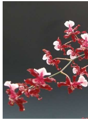
Sharry Baby Sweet Fragrance