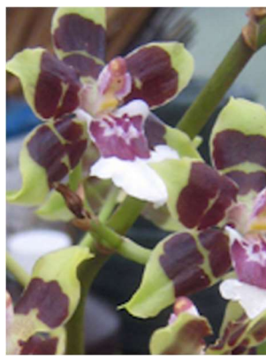
Milt. Cleo's Pride