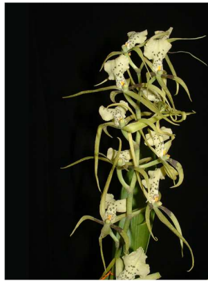
Brassia Rex "green"

http://antilles-biotech.com/abt-fr/proorchid-fr.htm