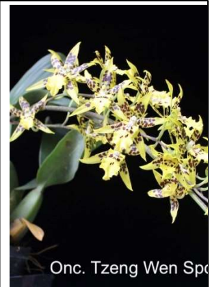
Tzen Wen Sport