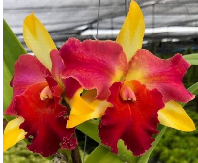
Amazing Thailand 'Red Star' Code:9001

http://antilles-biotech.com/abt-fr/proorchid-fr.htm