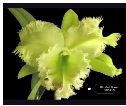
Golf Green "Piggy Hair" Code:9000