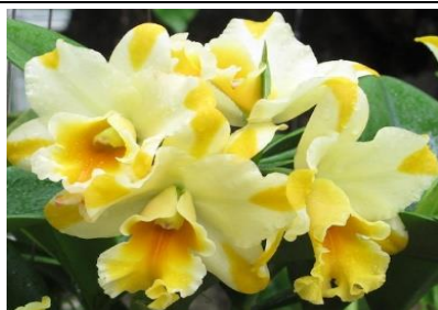
Nell Hammer Code:9008