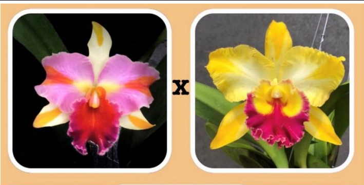
Rlc. Amazing Thailand