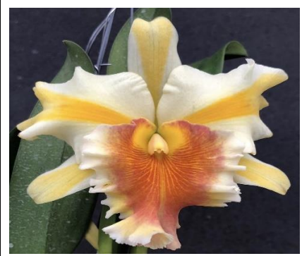
Miss Thailand 'Chutima' Code:9004