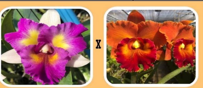
Rth. Thai Song