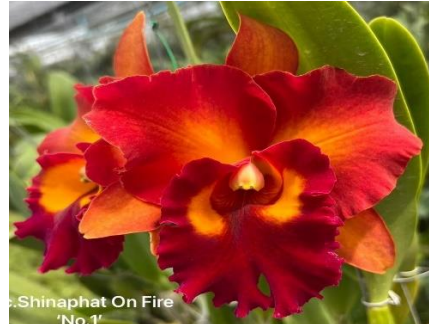
Shinaphat on Fire Code:9007