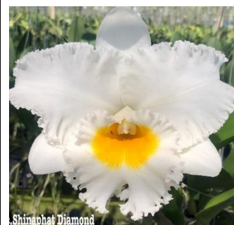
Shinaphat Diamond 'White Swan' Code:9006