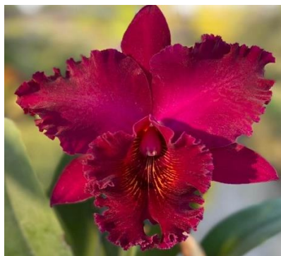
Chailin New City Code:9003