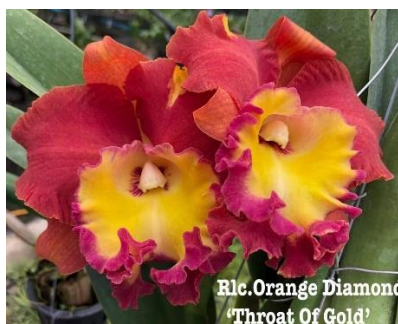
Orange Diamond 'Throat of Gold' Code:9005